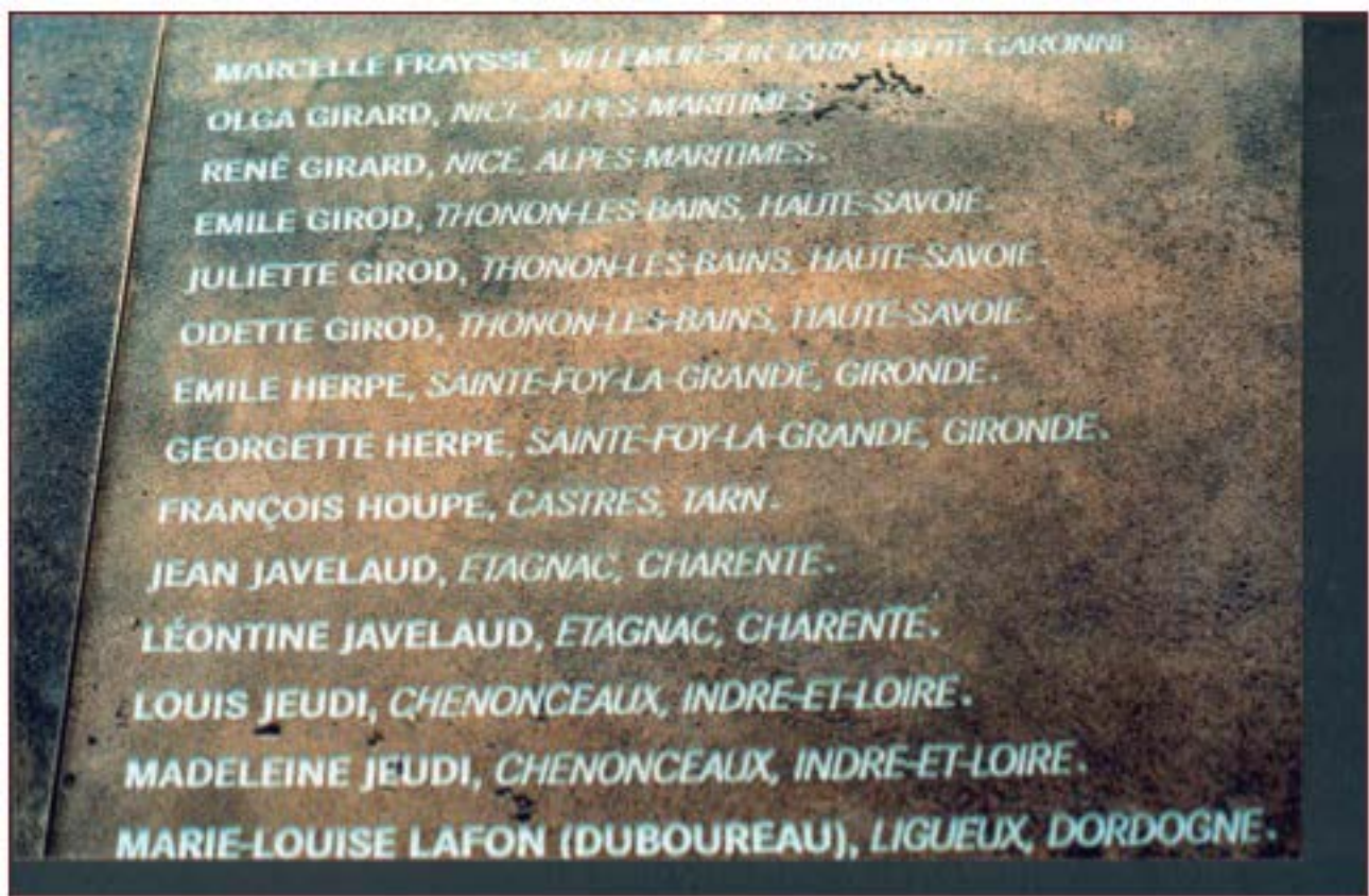
Inscription au Mur des Justes (Émile et Georgette Herpe)