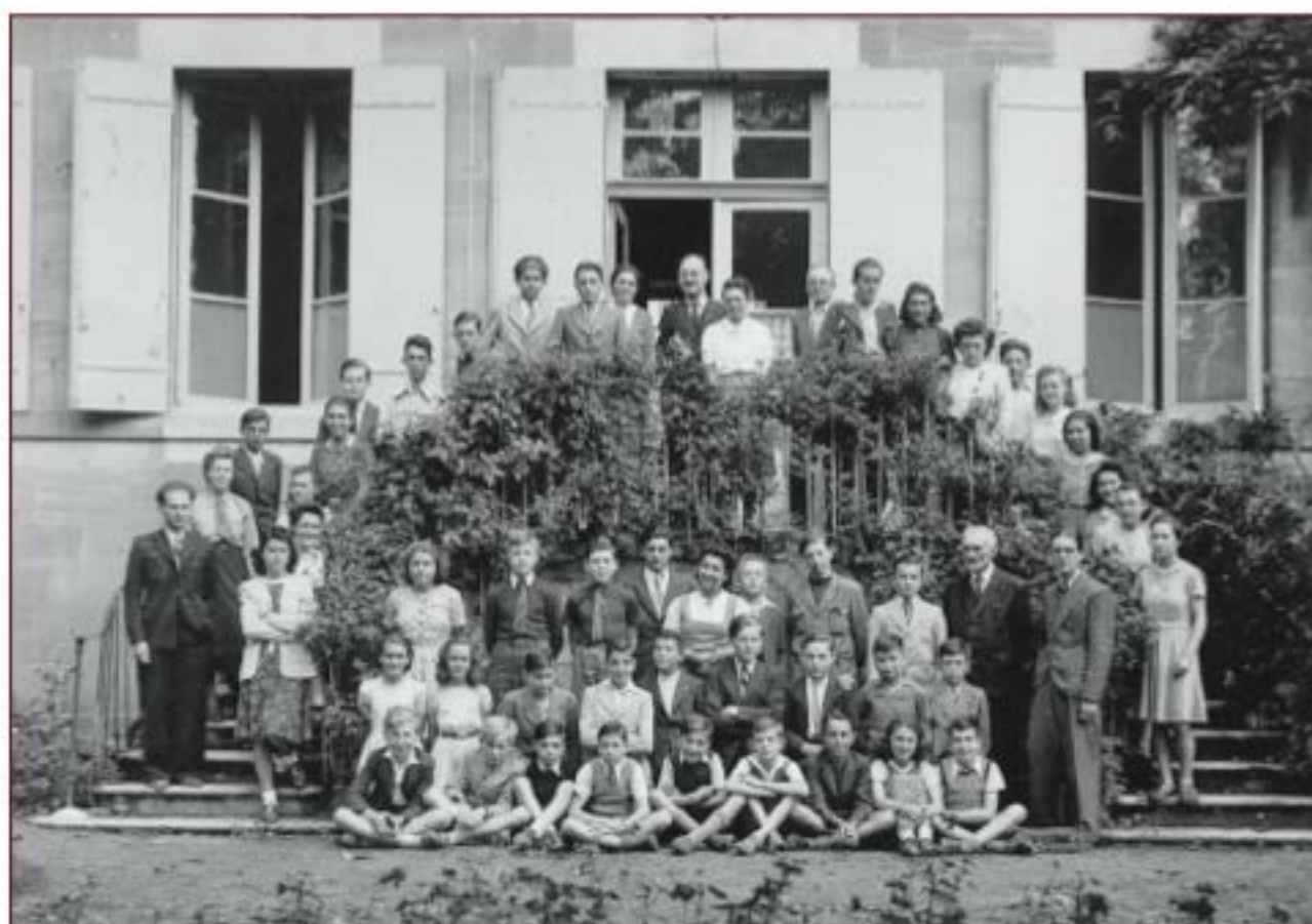
École de Guyane (1941-1942)