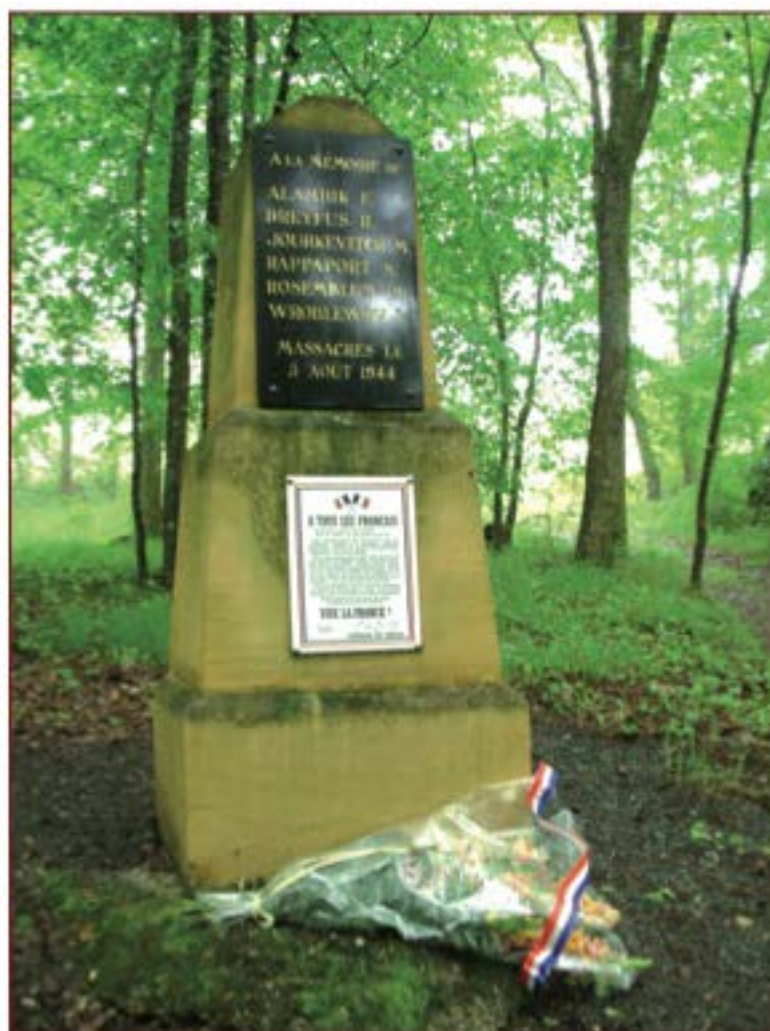
Stèle des fusillés, Soullou (Le Fleix, Dordogne)