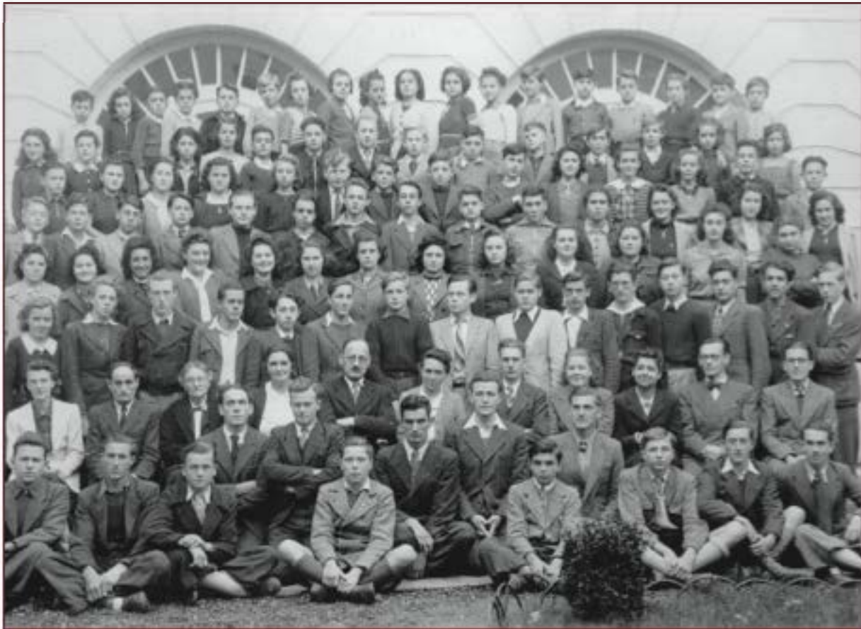
École de Guyenne (1942-1943)