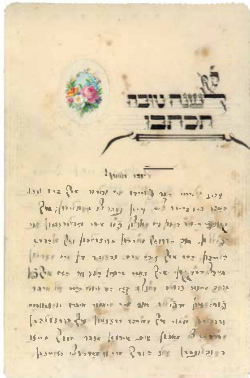
Intéressante carte de vœux pour le Nouvel An juif adressé par Marcel Bing, oncle de Simon Oungre à ses parents, fin du XIX e