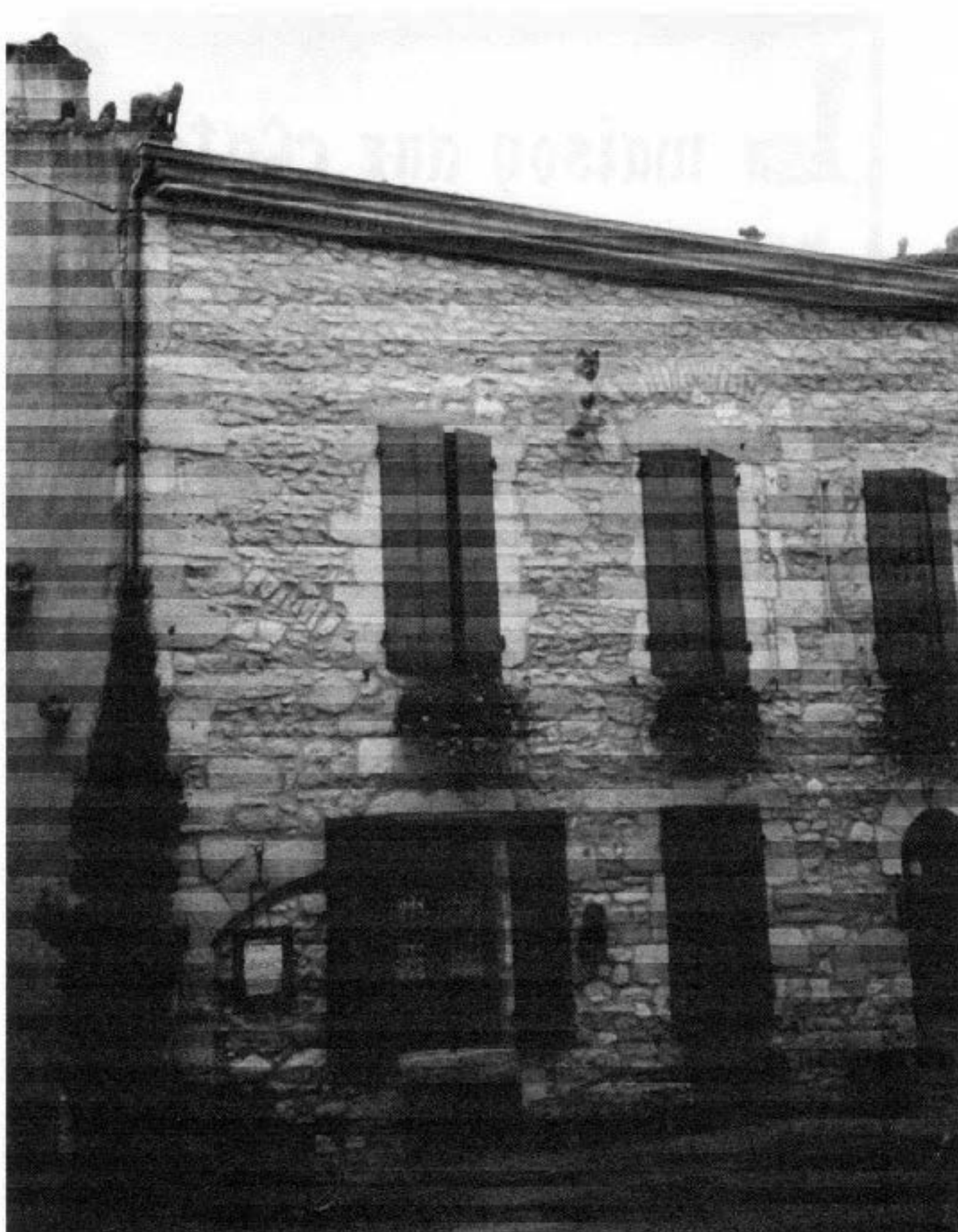
Maison de Pardailan (cite ces chats) à Gensac.