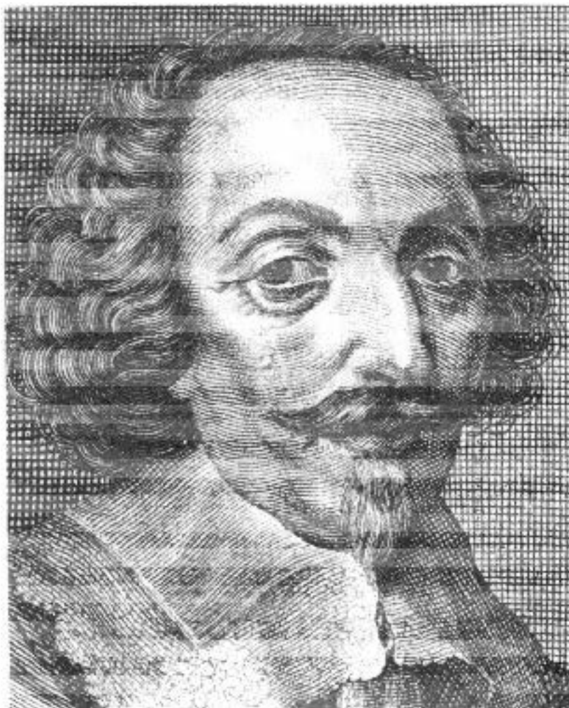
Henri duc de Rohan. Gravure du XVII e . (Le Robert dictionnaire universel des noms propres, édition 1980.)

Face à l'armée royale, nous allons voir les grands seigneurs protestants jouer à leur jeu favori : combattre et négocier leur trahison. Le duc Henri de ROHAN, gendre de SULLY, chef incontesté du parti fut le dernier à se soumettre. Allié aux maisons