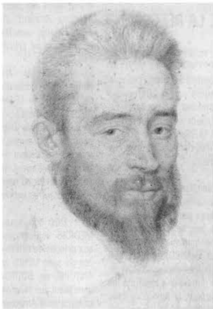
Henri de Guise par F. Clouet vers 1585. (Musée Condé, Chantilly.) (Le Robert dictionnaire universel des noms propres, édition 1980)