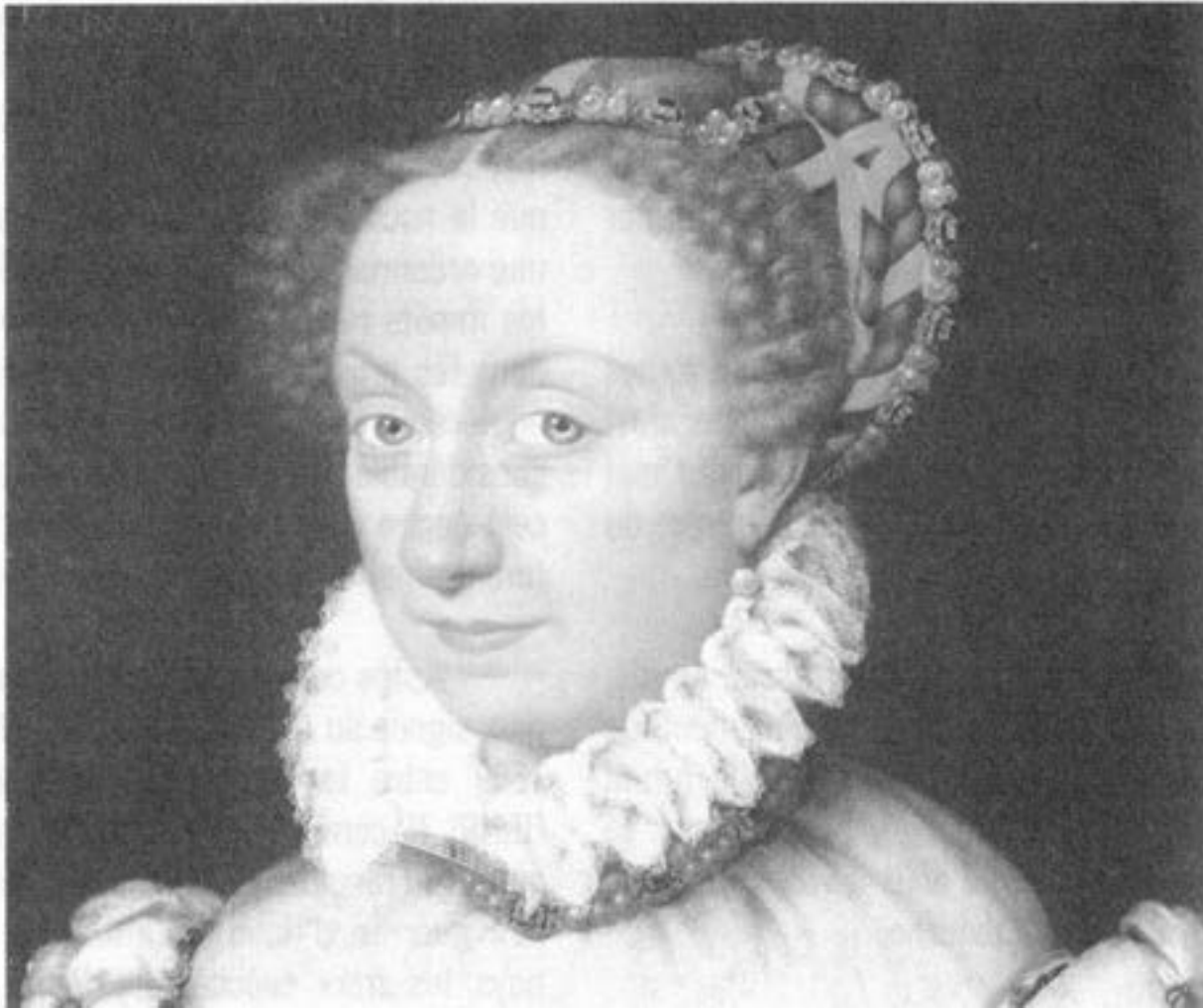
Jeanne III d'Albret, Reine de Navarre par F. Clouet. (Musée Condé, Chantilly.)

quatre cent quarante aux galères ou au fouet.