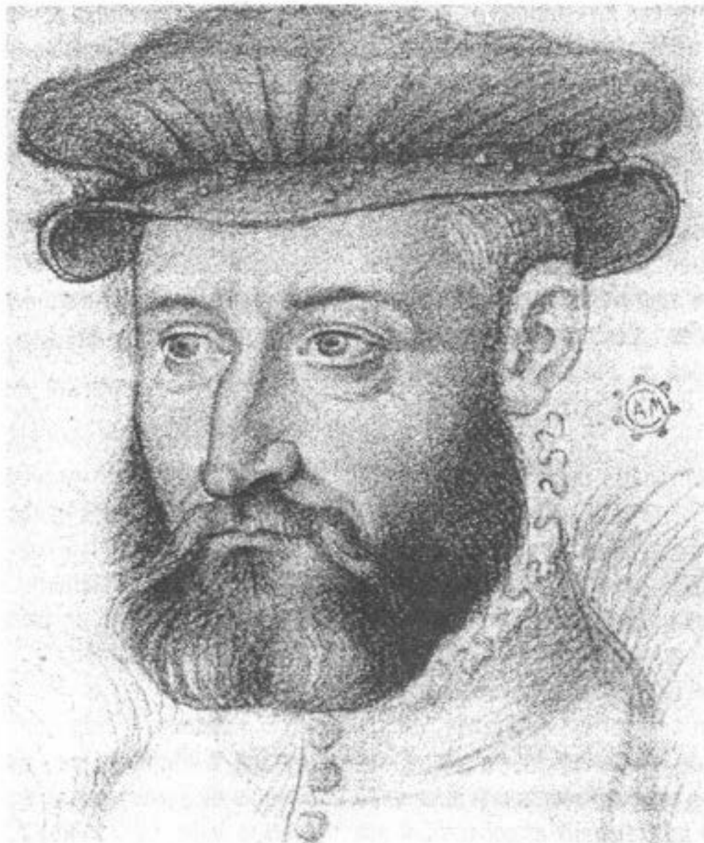
Germain-Gaston de FOIX comte de Gurson et de Fleix, marquis de TRANS (cousin d'Henri de Navarre) (Reproduction partielle d'un dessin conservé à la Bibliothèque des Arts et Métiers.)