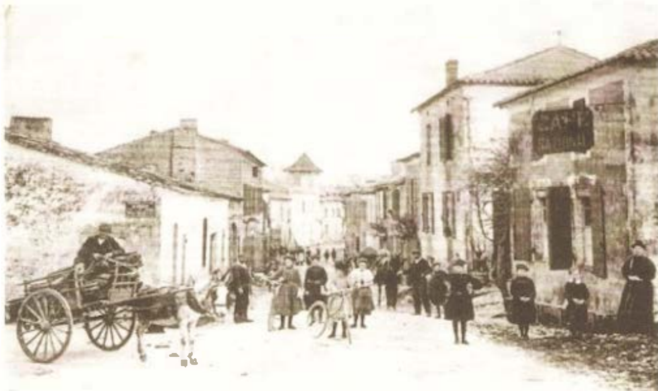
2. - LYNESSE (Gironde). - La Grand Rue. - BH