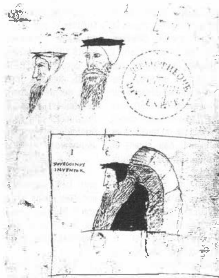
Croquis à la plume exécutés vers 1560 par l'étudiant Jacques Bourgoin de Nevers, représentant Théodore de Bèze en haut et Jean Calvin en bas. Bibliothèque publique de Genève, Photo Snark International, Moesoo 1988.